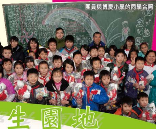
團員與博愛小學的同學合照