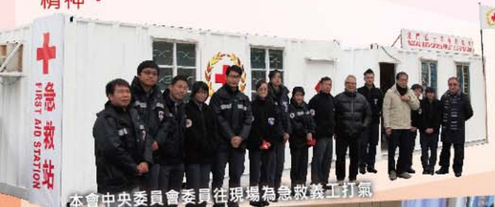
本會中央委員會委員往現場為急救義工打氣

活動期間還時值寒流來臨，多日氣溫低於十度，在救護站內亦感覺到陣陣寒意。儘管如此，各值班義工仍堅守崗位，遇有傷者亦迅速地為他們治理，盡現救急扶傷的精神。