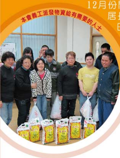
本會義工派發物資給有需要的人士

為弱勢社群提供支援，加強社區關懷，是本會工作重點之一。本年度的“寒流顯愛心活動”在12月份開始，持續到農曆新年前後，本會組織了超過122人次的義工，造訪了獨居長者、安老院、長者中心、弱勢家庭等近500位人士，為他們送上大米及日常用品以表關懷。本次活動除了探訪外，還安排節日聯歡，希望藉此提升對弱勢群體的關注。