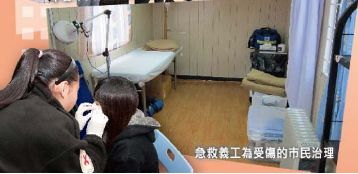
急救義工為受傷的市民治理