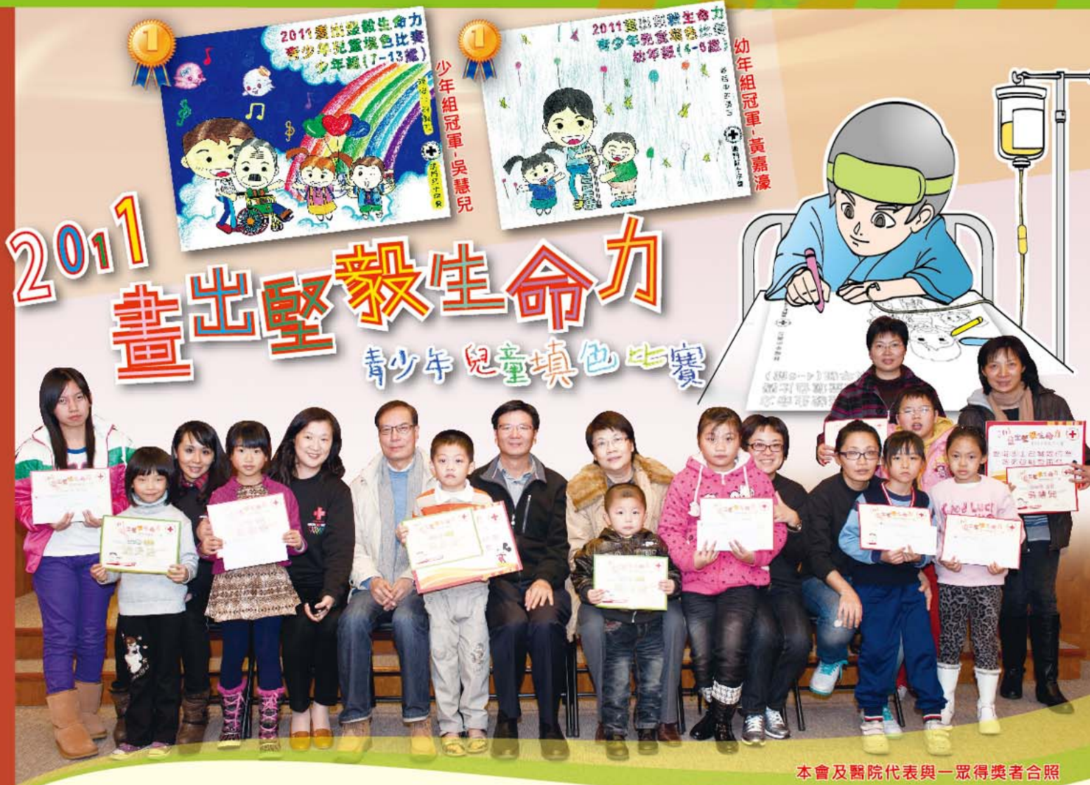
本會及醫院代表與一眾得獎者合照

對於患病的小朋友來說，需要長時間留在醫院病房接受治療，錯失了很多參與活動的好機會。因此，本會自2004年起，在本澳兩間醫院醫護人員的熱心協助下，連續8年舉辦了“畫出堅毅生命力青少年兒童填色比賽”，讓病房兒童獲得了發揮創作及繪畫天賦的機會。