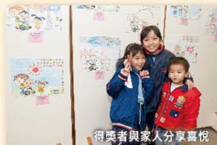
得獎者與家人分享喜悅