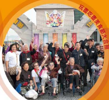
玩盡吃盡美食節大合照