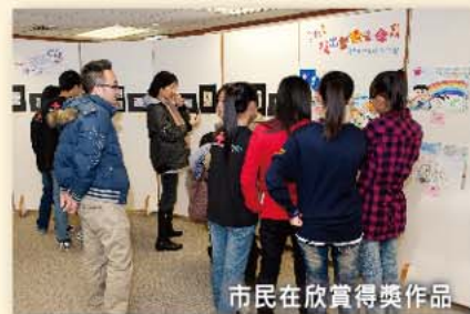
市民在欣賞得獎作品

紅會除了關懷住院的兒童，還定期為有需要的青少年及兒童舉辦不同的活動，希望藉此提升社會對他們的關注。