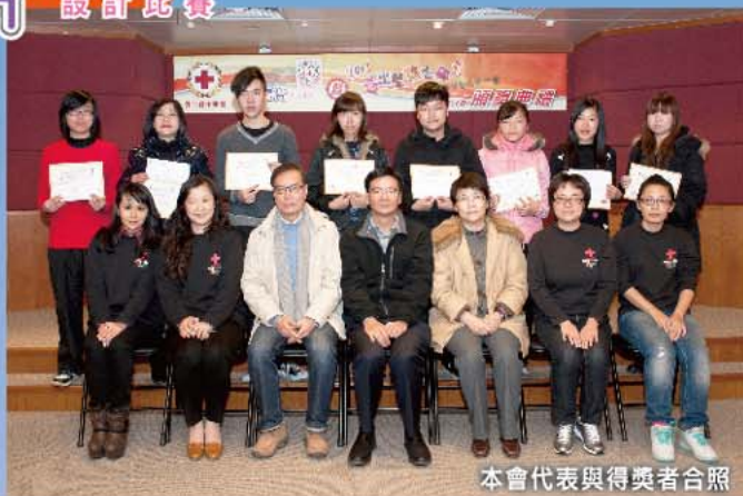
本會代表與得獎者合照

12月10日本會進行了《紅十字“明信片”設計比賽2011》頒獎儀式，得獎名單如下：