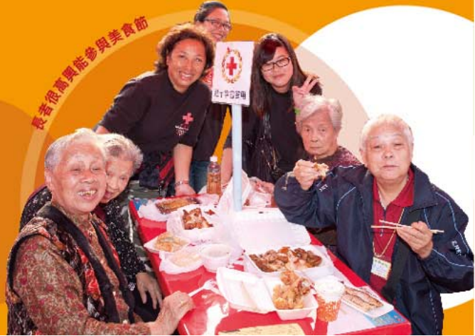
長者很高興能參與美食節