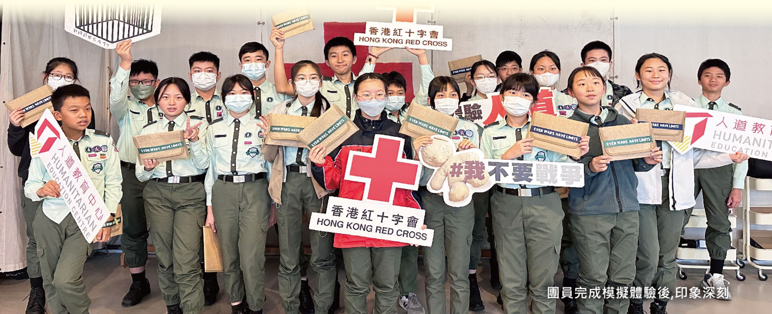
團員完成模擬體驗後,印象深刻

透過這次活動讓團員們更了解人道法的重要性、戰爭的可怕與深遠的禍害。也讓團員們明白戰爭並不遙遠，每人都可以做一些力所能及的事，關注及關懷身邊人與事。