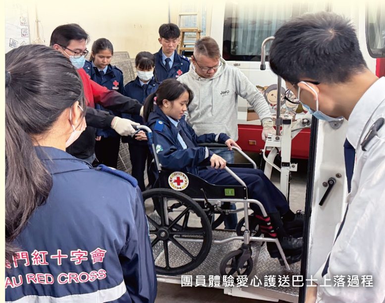
團員體驗愛心護送巴士上落過程

在街上看到護送巴士，更會增添一份親切感。同時，亦會向有需要的人士推廣有關服務，讓他們能得到便利及安全的關愛服務。