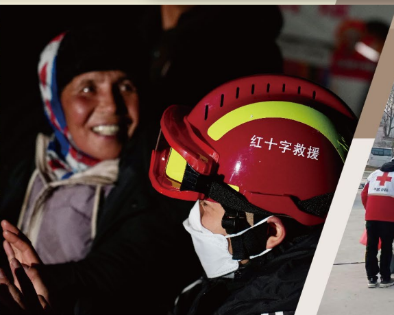
▲ 全省的紅會救援隊先後抵達災區