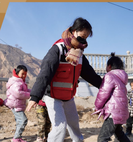
▲ 紅十字會志願者為災區孩子提供心理輔導，開展互動遊戲