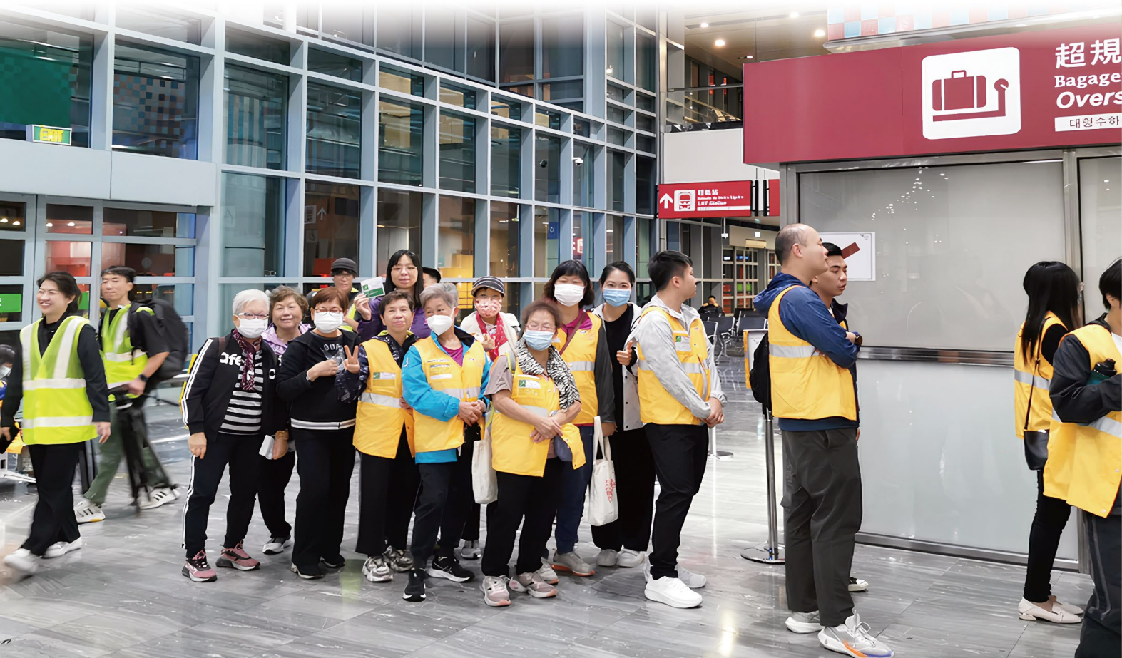
本會派出近50名職員及義工參與演習

本會參加者透過模擬不同身份，從中對災難意外的整體處置，災難的分流有深入的瞭解，同時亦體會到在災難發生時，作為乘客及傷者的不安情緒，對今後急救服務有指導作用。除了傷勢的處理外，亦能適切地為傷者進行人文關懷，舒緩不安的情緒。參與大型的演習，讓義工有機會對社會有更多的瞭解，開拓了眼界，亦讓我們從不同的角色學習服務社會的知識。