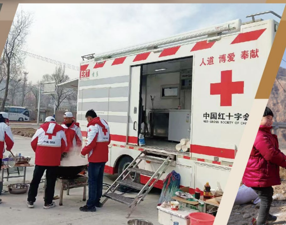
▲ 賑濟救援隊及供餐車趕赴災區，開展緊急供餐服務