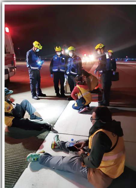
模擬傷者在現場等候救治

司法警察局、消防局、旅遊局、衛生局、社會工作局、海事及水務局、民航局、澳門航空有限公司、澳門保安有限公司和明捷澳門機場服務有限公司。演習最終達到預期效果，整體參與人數約500人，本會近50名職員及義工參與了演習。