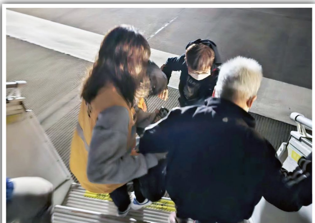
模擬緊急情況下撤離機艙

飛機上的乘客被突如其來的煙霧縈繞，開始感到焦慮，乘客為了安全，必須按照機艙人員的指示按序進行疏散並離開機艙，踏出機艙門後，乘客根據指示在相應的地方集合。意外造成的傷亡人員，被迅速送往醫院接受治療，受輕傷乘客則留在原地接受救援人員的處理，然後分批送往機場大樓及入境大廳。另一方面，心急如焚的乘客家屬及記者亦急切地詢問家人及傷者情況，機場職員上前安慰並協助讓大家了解情況。