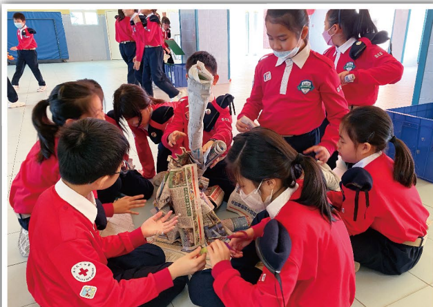
團員們互相交換意見

透過這個階段培訓，讓團員們能領悟到團隊合作精神的重要性，從而學會彼此尊重、支持與信任，以及鍛煉身體、挑戰自我，促進身心發展。