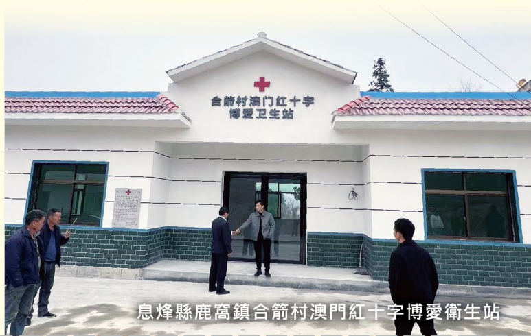
息烽縣鹿窩鎮合箭村澳門紅十字博愛衛生站

息烽縣兩衛生站，是澳門紅十字會自2006年起幫扶貴州脫貧攻堅的第86個項目，並依照近年本會援建衛生站的標準模板建成。項目標準化設計的優點是便於品質和成本控制，有利於提升本會的標識度和宣傳度。多年來，本會致力援助完善偏遠農村地區的教育、醫療環境，其中，更多的村衛生站標準化建設相信能為農村基礎醫療網絡的全域覆蓋打下堅實基礎。