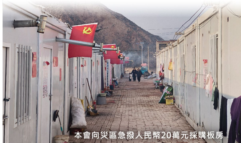
本會向災區急撥人民幣20萬元採購板房

災民基本生活雖暫時得到保障，但重建家園仍然是受災群眾最殷切的期盼。本會將持續關注災後發展，同時與中國紅十字會總會與甘肅省紅十字會保持緊密聯繫，待災後重建規劃落實後，本會將派員到當地選點及參與災後重建工作。