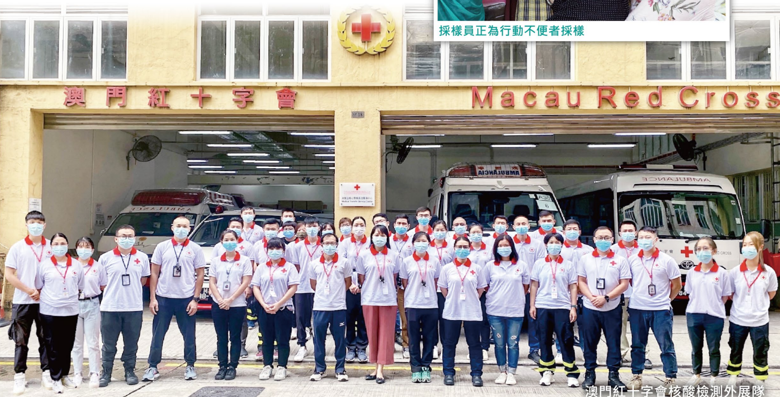
澳門紅十字會核酸檢測外展隊