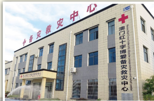
澳門紅十字博愛備災救災中心外觀

出席竣工儀式的嘉賓還包括全國人大常委會副委員長兼中國紅十字會會長陳竺，以及湖北省紅十字會相關領導等。黃如楷主席與陳竺會長同為中心揭牌，隆重宣佈備災救災中心落成。該項目在疫情期間規劃、考察、實施到落成，經歷了重重困難，在多方共同努力下，項目如期完工並可立即投入使用，大力提升了英山縣乃至湖北省紅十字系統的抗災救災能力。陳竺對中心的落成表示熱烈祝賀，並對澳門紅十字會慷慨援建表示衷心感謝，他還指出澳門紅十字會積極參與澳門特區的防疫工作，為澳門市民的福祉提供了形式多樣、完善週到的人道服務，得到澳門特區政府和市民的廣泛好評，值得其他紅十字組織學習與借鑒，對此充分讚譽！