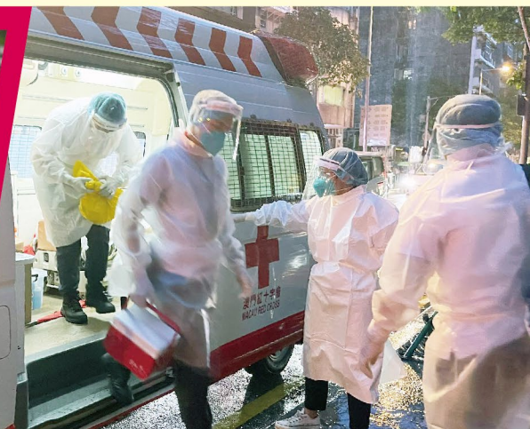
▲工作隊員於颱風過後再次出發