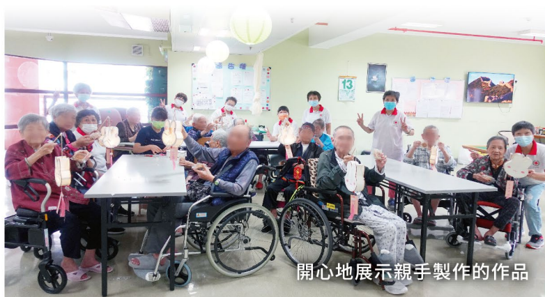
開心地展示親手製作的作品

詳情請瀏覽本會網頁 www.redcross.org.mo 電話: 2831 3003 傳真: 2831 3024