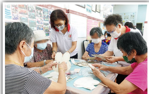
攜手製作中秋花燈

此外，贈與長者們的「心意卡」是由本會小太陽教室一眾小學員及其家長共同製作，他們把滿滿的祝福編織成這份精美的作品，期盼長者們能領會到這份看得見的溫暖，一起歡度佳節，以及感受到被愛與關懷。