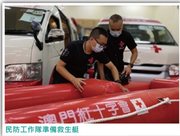
民防工作隊準備救生艇

酸檢測外展隊指揮及協調中心」改為「民防工作隊指揮及協調中心」繼續運作。在颱風期間我們嚴陣以待，民防工作隊隊員檢查所有設施及緊急車輛，做好應對颱風和風暴潮的準備及通訊工作，以應對來襲的風暴，直至8號風球除下為止。