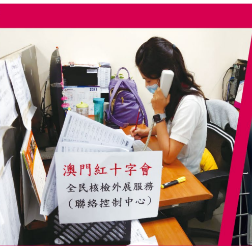
▲職員聯絡有需要人士