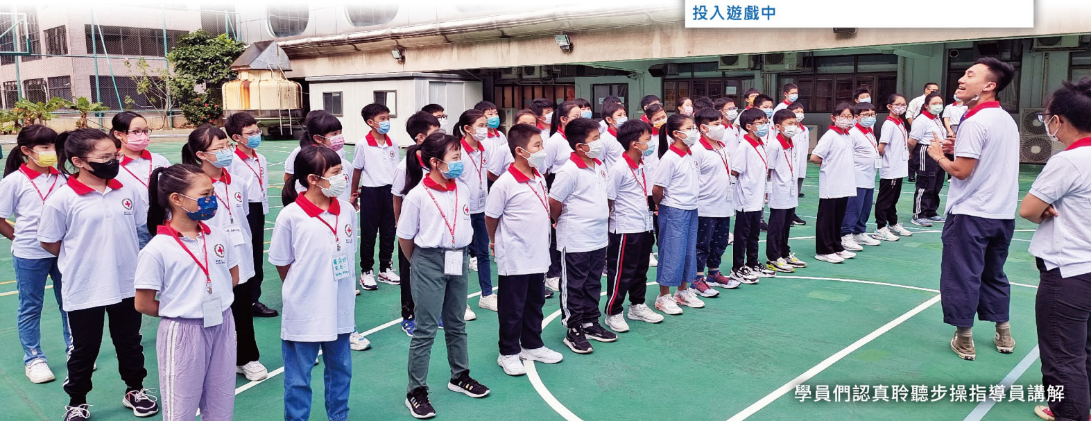
學員們認真聆聽步操指導員講解