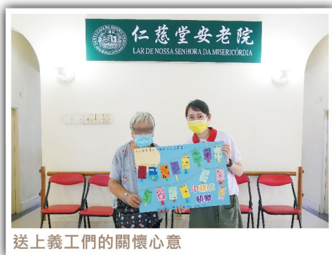
送上義工們的關懷心意

適逢中秋佳節，本會開展了「紅會中秋顯關懷」系列活動，社區義工們前往「菩提長者綜合服務中心」，「海島市居民群益會頤康中心」，「仁慈堂安老院」及「欣頤居養老院」作親善探訪活動，同時送上心意卡，向長者們傳達節日的關懷與問候。