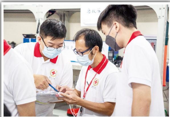
隊員仔細規劃各隊行動路線

2021年8月初，本地再現新冠病毒社區個案，特區政府隨即宣佈進入「即時預防」狀態，民防行動啓動，並於8月4日起開展一連3天的第一次全民核酸檢測。全澳市民均積極配合，扶老攜幼在風雨中不分晝晚趕赴核酸站點採樣。本會考慮到居於「唐樓」的長期臥床的本會非緊急醫療護送服務使用者前往站點採樣的實際困難，便主動聯絡有關使用者瞭解情況，並得到仁伯爵綜合醫院及美獅美高梅核酸站提供採樣專道協助，8月5日傍晚啟動核酸採樣護送服務。