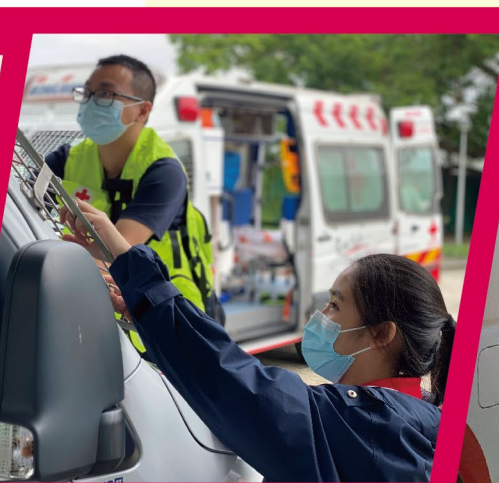
▲民防工作隊員為車輛加裝防護網