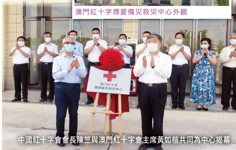
中國紅十字會會長陳竺與澳門紅十字會主席黃如楷共同為中心揭幕