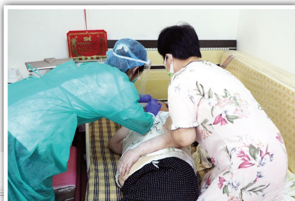
採樣員正為行動不便者採樣

最後，感謝每一位核酸檢測外展隊及民防工作隊的隊員，多日來用生命中點點星光，照亮每一位有需要的市民。我們將繼續恪守「努力防止並減輕人們的疾苦，保護人們的生命和健康」的紅十字精神，盡最大的努力為有需要的人士提供支援，竭力配合特區政府的抗疫、防災工作。祈願本澳以至全球的疫情早日結束，回復到美好的日子。