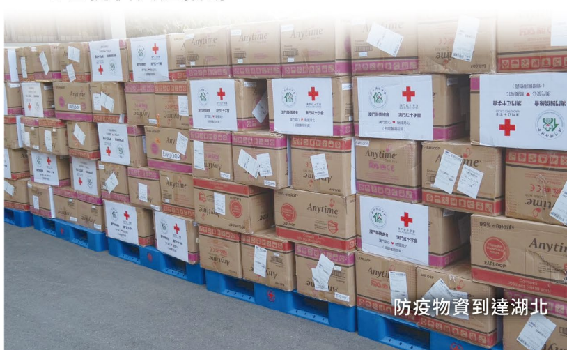
防疫物資到達湖北