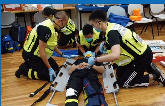
模擬骨折個案處理