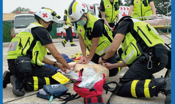
模擬心跳驟停個案處理