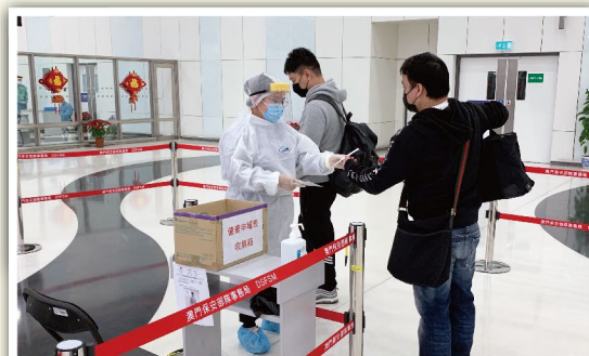
口岸工作人員接收旅客入境時所填的健康申報表

藉着5月8日世界紅十字日，不同地區的紅十字會都拍下短片，以掌聲(#KeepClapping)向仍在前線砥礪前行的人員致以真摯的感謝。