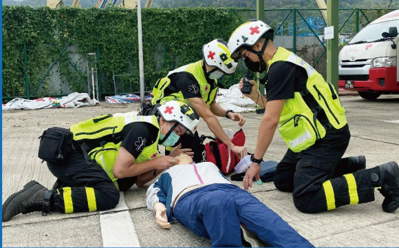
模擬發現昏迷個案處理

經過多次的訓練後，隊員們在5月10日通過了評核，內容除了基本的急救個案處理外，也包括了下列的體能評核：耐力折返跑、立俯撐、俯撐取放、平板撐等。務求令新一屆民防工作隊員能以最佳狀態應對工作。