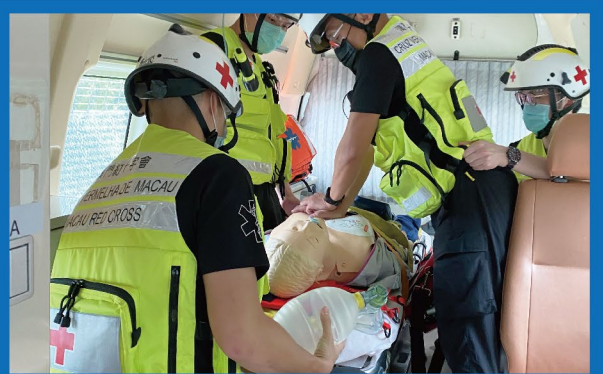
模擬心跳驟停個案處理