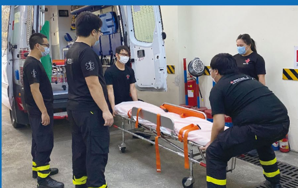
練習使用救護車床