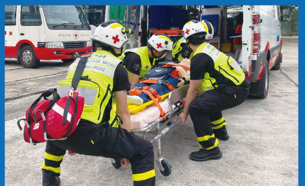
模擬昏迷個案搬運