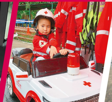
▲ 模擬本會不同崗位的工作