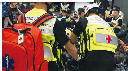
民防工作隊隊員在避險中心候命