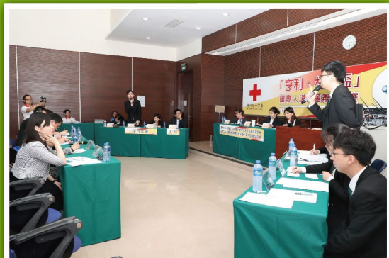
雙方辯員就辯題展開激辯

本會於4月28日假澳門科技大學舉辦了「亨利·杜南盃」國際人道問題辯論比賽，藉此推廣人道教育工作，宣揚國際紅十字和紅新月運動的基本原則，以及日內瓦公約，冀望加強本澳青少年保護和尊重生命的意識。活動邀請得澳門大學、澳門城市大學及澳門科技大學的普通話辯論隊參與，從多方面共同探討國際人道議題，競逐比賽獎項。