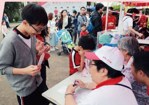
▲ 透過攤位遊戲認識本會工作及各種日常生活知識