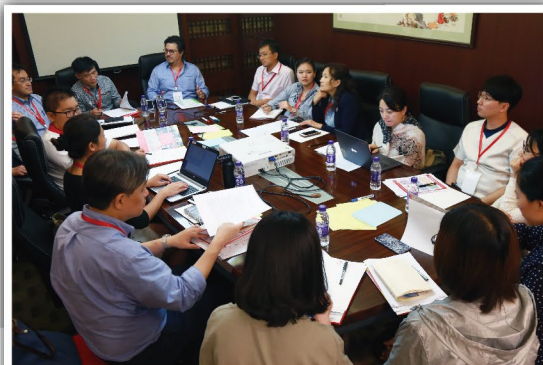
參與者就應對大型災害方法進行小組討論

為期3天的討論中，本會與東亞各地的紅會代表對大型自然災害種類進行了深入分析和廣泛交流，與會者們分享了各自紅會應對大型災害的方法，區內大型自然災害發生後，各國紅會應如何協作是本次會議討論的重點議題。