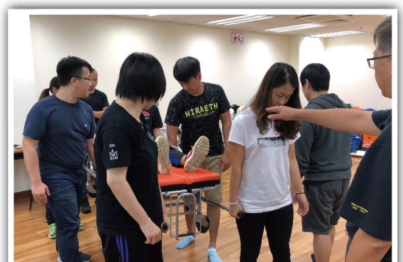
反復實踐做到最好

澳門紅十字會一直致力推廣急救知識，每2年都會舉辦急救導師培訓課程，以回應社會的需求。本屆(2019年度)已於本年4月6日正式開課，經過筆試和操作試的甄選，共有13位學員踏上導師培訓之路。在第一部份的〈急救學深造課程〉中，培訓導師以風趣幽默的方式帶領學員認識各種急救技術的原理、器材的使用時機以及急救隊的團隊合作精神等。在此階段完成後，學員將進入第二部份的〈教學法課程〉及第三部份的〈教學實踐階段〉，整個課程需時2年。