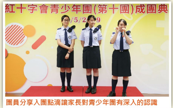
團員分享入團點滴讓家長對青少年團有深入的認識

典禮上還為6名團隊領袖進行晉升儀式，並嘉許了25名志願服務時數分別超過50、150、250、400及600小時的團員，表揚他們熱心參與社會服務。