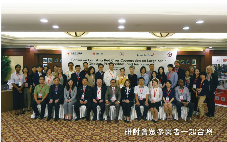
研討會眾參與者一起合照

會議認為：東亞各國及地區所面對的災害既有差異性，但更有具參考價值的共性，大型自然災害具對受災地區影響深遠，破壞力難以預估、沉重打擊經濟的特性；但相比南亞及非洲等地，東亞屬高收入地區，經濟發展水平較高，因此在災害管理時宜採取差異性策略。區內各國紅會需了解自身的優勢及專長，在緊急賑災和災後重建