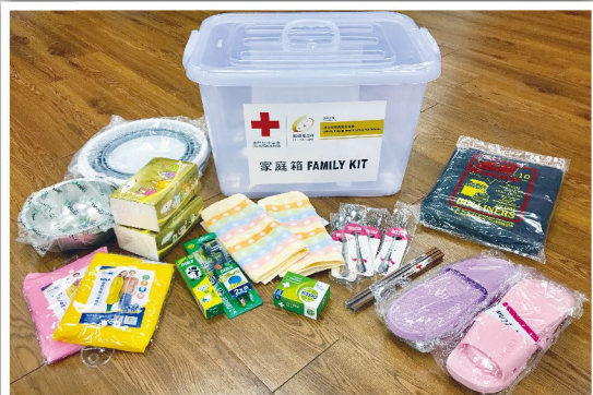
家庭箱內齊備應急物品

，可供部份受影響的市民在災發時緩解燃眉之急。本會更會派員前往沙梨頭區及下環區，為市民宣傳防災備災知識。