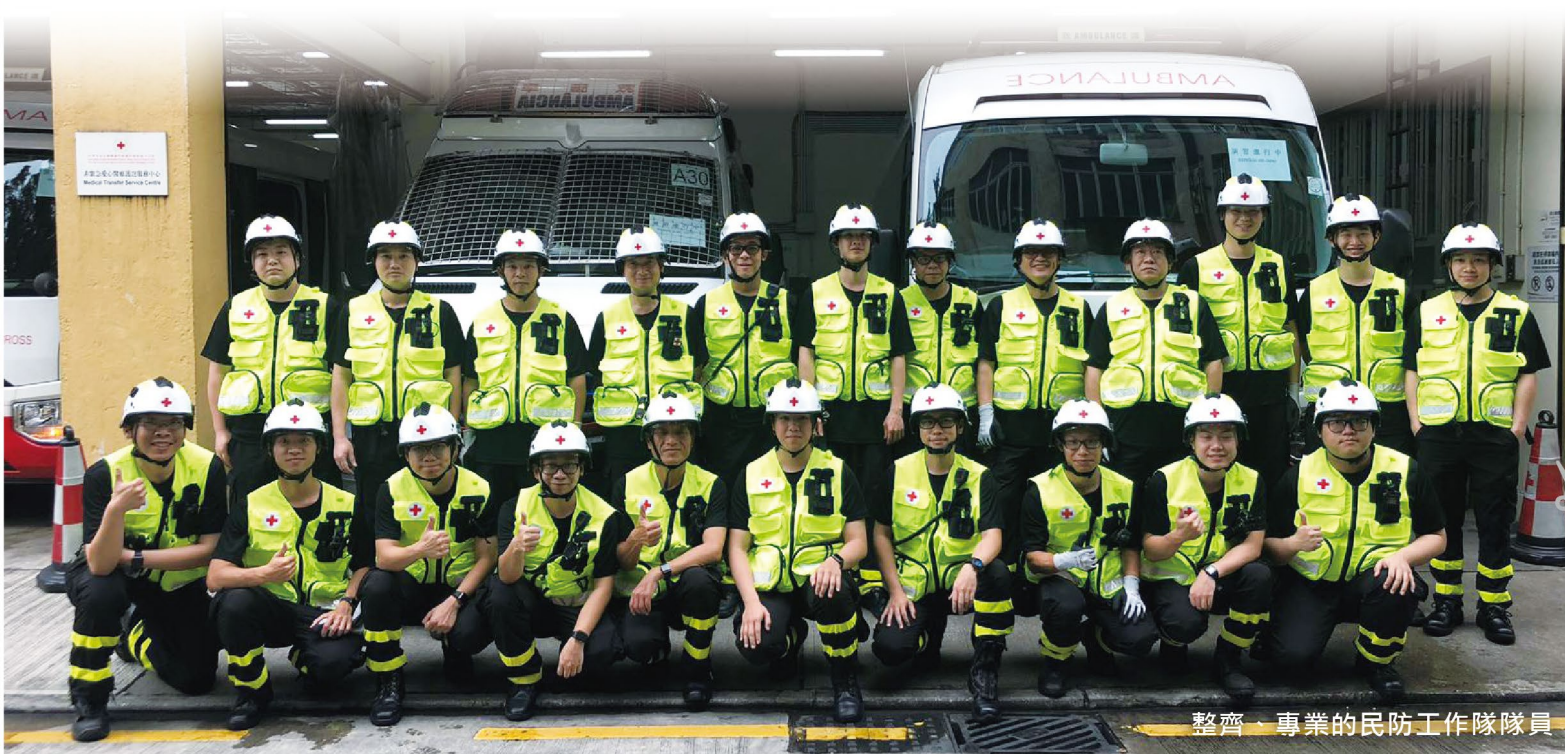
整齊、專業的民防工作隊隊員

透過演習促進了與民防架構各成員間的溝通、合作，同時實地的演練，增強了隊員對低窪地區疏散撤離工作的信心。