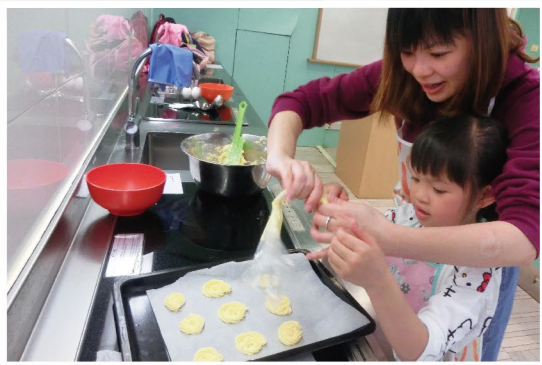
享受一同製作的過程

本年度的兒童發展項目中，本會繼續安排了各種不同形式的親子活動，除了讓學員增長課外知識外，更為重要的是能夠從中與父母建立起深厚的情感及默契，因為家庭教育、家長的關懷溝通都是兒童健康成長的過程中不可或缺的一環。