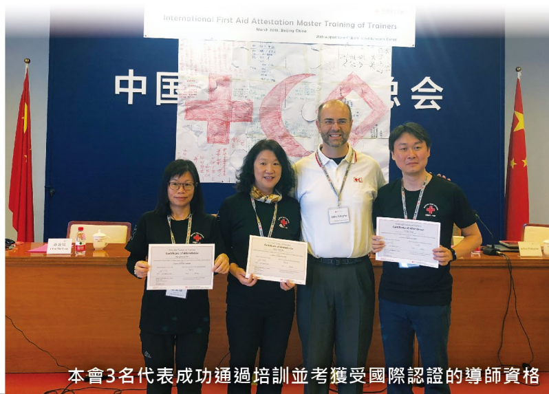
本會3名代表成功通過培訓並考獲受國際認證的導師資格

透過這次培訓，為本會推廣急救工作的持續發展奠定了良好的基礎，同時也開啟了本會急救培訓課程國際認證之路。