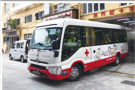
當收到民防行動中心撤離指示後，民防工作隊馬上安排車輛及隊員前往指定的地點協助行動不便的市民前往避險中心。

為強化市民對「颱風期間風暴潮低窪地區疏散撤離計劃」的認識，民防行動中心於4月27日下午舉行代號「水晶魚2019」大型颱風演習，澳門紅十字會作為政府民防架構的成員之一，本次行動共派出3輛護送巴士、1輛救護車及24名民防工作隊隊員參與了演習。