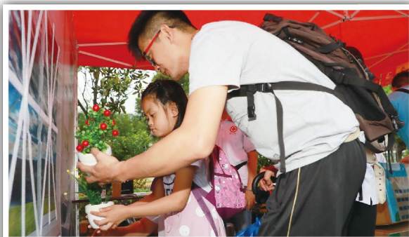
親子合作，樂在其中

一如過往，澳門紅十字會每年都會響應這個大日子，舉辦宣傳活動讓廣大市民參與，希望他們在當中加深對紅十字會工作的了解，同時認識人道、急救、識災防災、社區關愛等方面的相關知識。今年本會於5月4日假鴨涌河公園，與廣大市民一起慶祝「五·八世界紅十字日」，活動得到大批市民前來支持，場面非常熱鬧。活動開始先由本會一眾