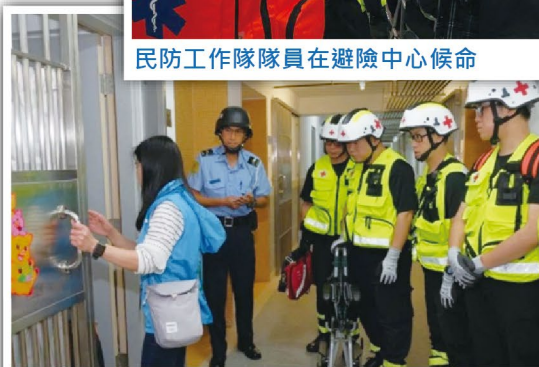
與民防架構成員合作上門接送行動不便人士

透過演習促進了與民防架構各成員間的溝通、合作，同時實地的演練，增強了隊員對低窪地區疏散撤離工作的信心。