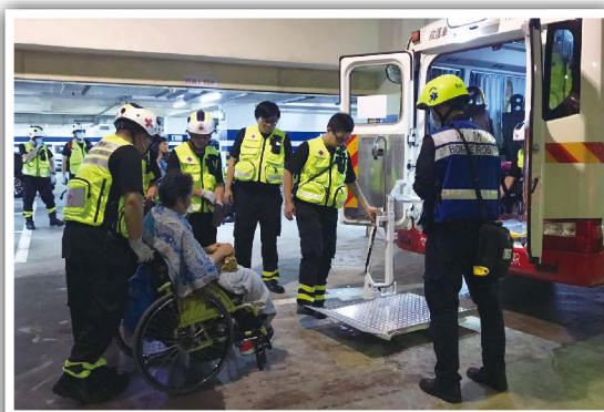
使用升降台協助行動不便人士上落護送車輛