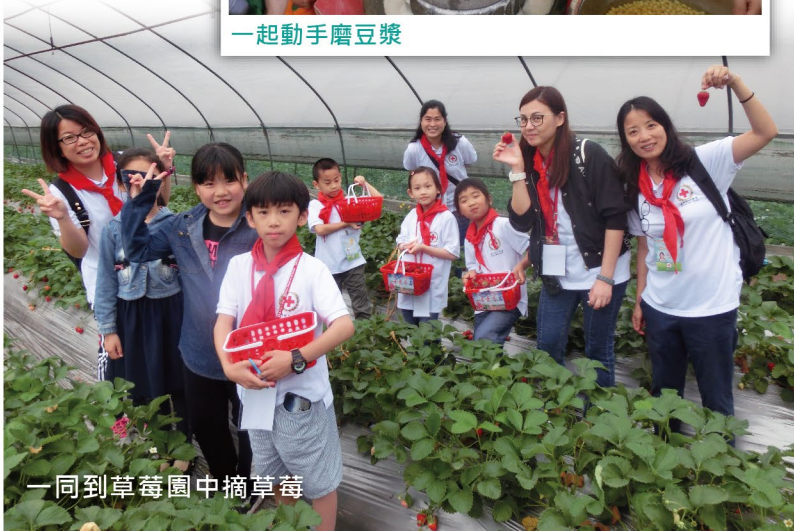
一同到草莓園中摘草莓