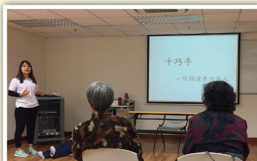
長者認真學習保健常識

參加者學習「十巧手」後，感覺把按摩從穴位延伸到筋絡，表示身體已經暖和了很多，坐著也能達到按摩和保健的效果。因此不只是長者，「低頭族」也可以利用玩手機的空檔練習幾招，對於舒緩身體不適非常有效。