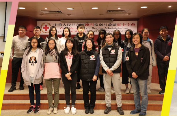
▲ 澳門紅十字會學校校長與紅十字會海星急救組合照