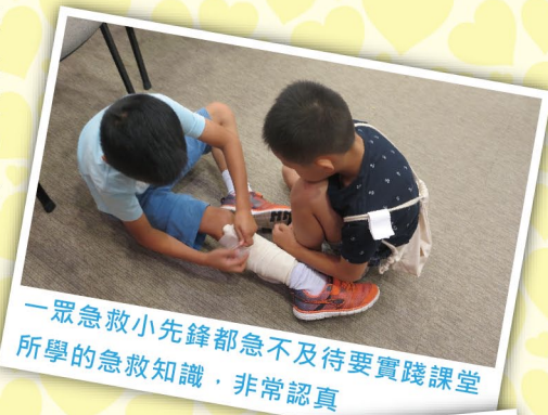
一眾急救小先鋒都急不及待要實踐課堂所學的急救知識，非常認真

兒童是社會未來的支柱，提供機會使他們於健康和善良的環境中成長，有助他們日後成為推動紅十字運動的一份子。以人道的心，作人道的事，把尊重生命的良好風氣傳播到社區之中，讓更多的人可以在關愛共融，守望相助的環境中正面成長。