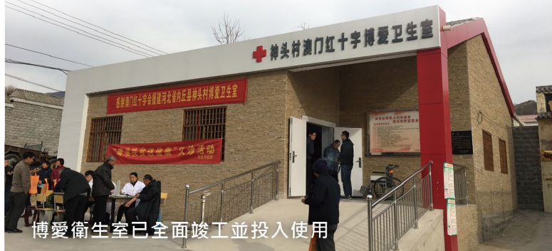
博愛衛生室已全面竣工並投入使用