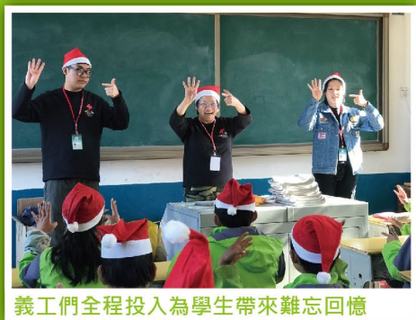
義工們全程投入為學生帶來難忘回憶

「助人自助」，參與義務工作的意義除了善用自己的能力去幫助別人，同時亦是個人能力的成長和提升。每年本會都會悉心安排一系列的活動給義工和市民參與，希望參與者可在服務的同時增廣見聞，透過體驗去認識不同層面的景況，有助他們反思社會中的深層問題，瞭解弱勢社群的真正需要，成為更全面的義工。