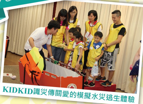
KIDKID識災傳關愛的模擬水災逃生體驗

澳門紅十字會一直非常重視幼童的身心發展，投放不少資源開辦各樣活動讓他們參與和體驗，因為明白到在漫長的育苗過程當中，首先要為每一顆小樹苗打好健壯的基礎，讓他們擁有健康正面的態度和價值觀，懂得分享和主動關懷別人的心，面對新生的事物充滿着好奇，謙虛地學習各類新知識，是幼童日後能成為茁壯大樹的關鍵因素。能從小開始培養個人良好品格、認識社會、掌握課堂以外的新知識，便不會局限了自己，更推動他們心懷願景，長大後為社會作出貢獻。