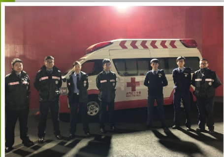
守護現場至最後一刻