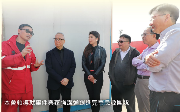
本會領導就事件與家強溝通跟進完善急救團隊

收到禮物和感謝信的喜悅無關禮物本身，而是成功救治一個生命的經歷。令更多人珍惜和尊重生命，的確是令本會感到自豪，也為每一個為救人自救而努力的天使感到驕傲。