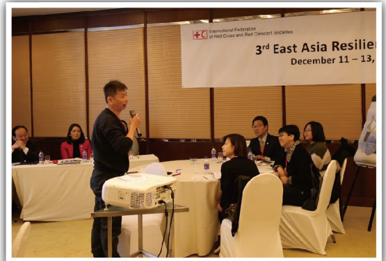
分享本會未來關於提高災害復原能力的計劃

作為人道救助機構，本會重新審視了增強社區韌性方面的工作，嘗試從備災防災理念和知識的普及推廣。從設立初級備災中心等路徑著手，以5年作為參照點，設立短中期到長期的防災減災計劃，深入社區，讓居民認識和瞭解可能影響所在社區的不同災害，學習應對技巧和使用例如滅火器、急救包、發電機等設備。並在社區推廣急救培訓，和協助社區內開發早期預警系統。還有制定災害時的人員和物資的安全分配計劃，期望把備災意識和技巧普及到全社會。