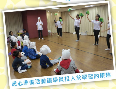
悉心準備活動讓學員投入於學習的樂趣