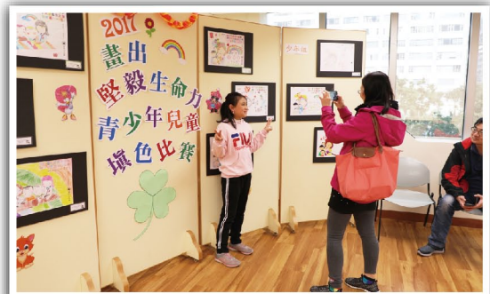
看見自己的作品獲獎興奮無比

填色作品一樣七彩繽紛。未來本會將有更多活動，致力把紅十字運動的博愛精神和正能量推廣出去，不論年紀，薪火相傳。