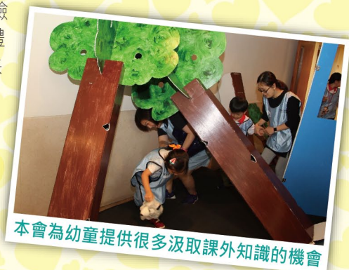
本會為幼童提供很多汲取課外知識的機會

良好的親子關係無容置疑地是孩童身心健康發展的關鍵，所以在「童十字」計劃當中，本會安排了不少親子共同參與的環節，希望孩童可以在善用餘暇去體驗的同時，也把體驗變成與父母共同創造的回憶，珍惜與父母相處的時間。本會透過「童十字」親親大自然、「KID KID識災傳關愛」的模擬