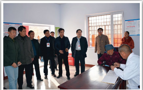
現場了解衛生室就診情況並作出評估

各級紅十字會代表人員，認真查看衛生室的建設狀況同時，了解到衛生室在神頭村的有關發展情況，並對博愛衛生室的進一步完善、發揮更大作用，提出了指導性意見。