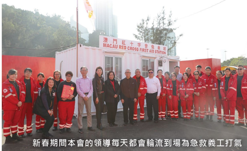
新春期間本會的領導每天都會輪流到場為急救義工打氣