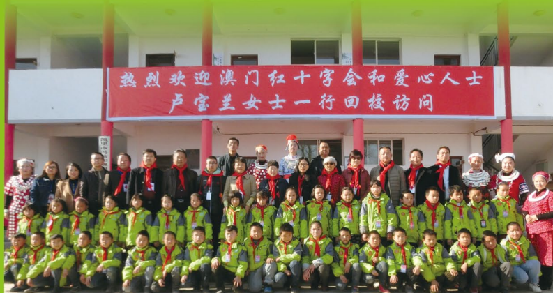
每年寒假本會都會組織義工送暖到遠處