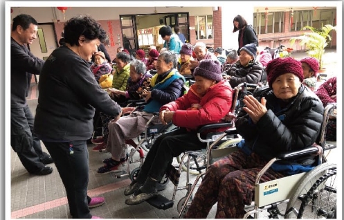
熱鬧的氣氛令一眾長者充滿了活力

把歡笑伴隨着愛心發送去社區的不同角落。這次義工們分別去了台山工聯健怡中心、扶康會寶利中心以及群益會頤康中心，與長者一同集體遊戲和唱歌等帶動現場的氣氛。透過健康講座，教授他們一些生活健康小常識，接受過合資格髮型師培訓的義工替他們理髮，務求為「客人」剪出一個他們所喜愛的髮型，以新面貌迎接新一年。