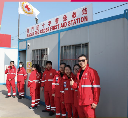
▲ 堅守使命 普及急救