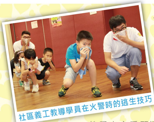
社區義工教導學員在火警時的逃生技巧