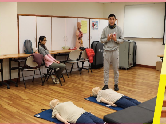
▲ 家強定期為學校急救隊進行培訓