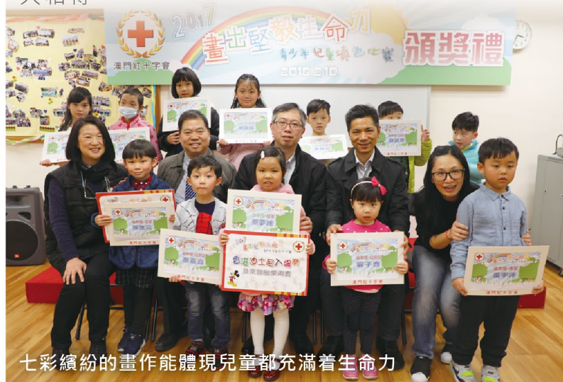
七彩繽紛的畫作能體現兒童都充滿着生命力