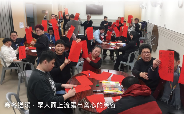
寒冬送暖，眾人面上流露出窩心的笑容