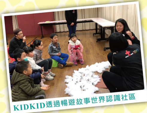
KIDKID透過暢遊故事世界認識社區

澳門紅十字會一直非常重視幼童的身心發展，投放不少資源開辦各樣活動讓他們參與和體驗，因為明白到在漫長的育苗過程當中，首先要為每一顆小樹苗打好健壯的基礎，讓他們擁有健康正面的態度和價值觀，懂得分享和主動關懷別人的心，面對新生的事物充滿着好奇，謙虛地學習各類新知識，是幼童日後能成為茁壯大樹的關鍵因素。能從小開始培養個人良好品格、認識社會、掌握課堂以外的新知識，便不會局限了自己，更推動他們心懷願景，長大後為社會作出貢獻。