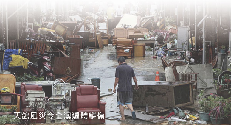
天鴿風災令全澳遍體鱗傷

澳門紅十字會初步計劃設立一個小型備災中心，其目的在於儲存一些備災應急包和毛毯、衣物、帳篷等，待有需要時立即發放給社區和學校，確保災害發生時有較充足的供應。