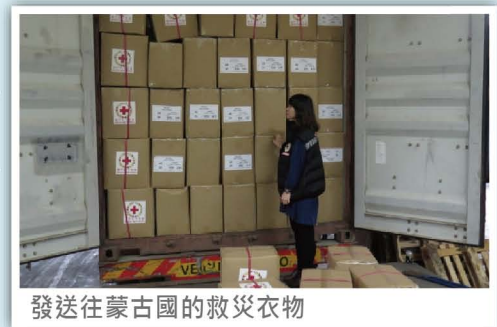
發送往蒙古國的救災衣物

力克製衣廠有限公司向來熱心公益,積極支持本會開展人道救助工作,曾多次捐贈大批全新高品質的衣物,用於國內外的賑災活動。