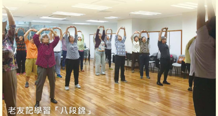
老友記學習「八段錦」

下一季講座的主題是「認識帶狀疱疹」，讓參與者認識帶狀疱疹，並剖析關於「生蛇」的迷思，以及相關民間的治療方法。