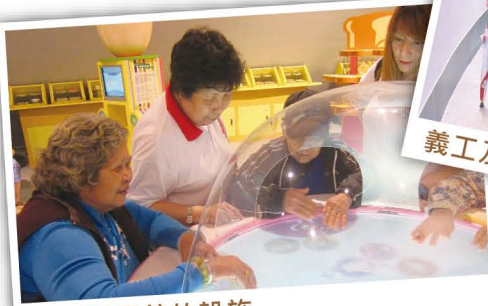
遊玩科學館的設施

生代的我們更應該努力學習，同時也要多花一點時間與長者溝通，相信能發現他們的喜好。