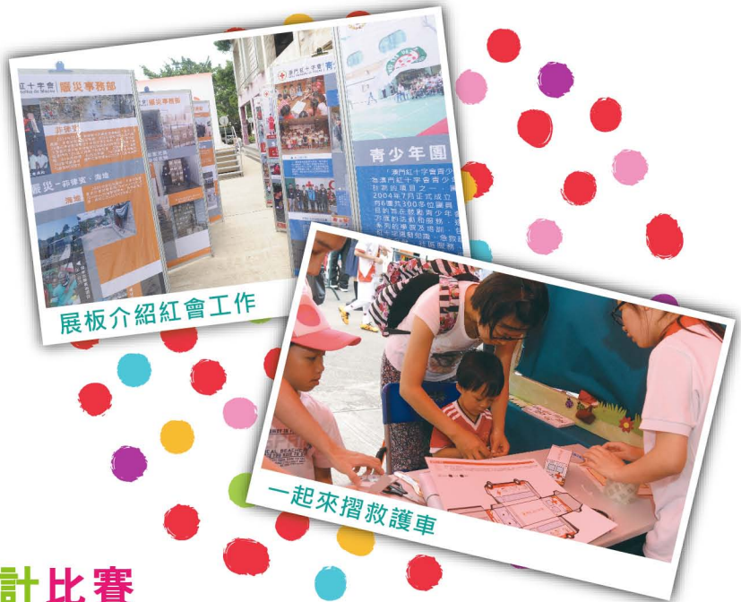
展板介紹紅會工作

活動當天雖遇驟雨，但仍無阻人流，現場所見，每個遊戲攤位前都排著等候的人龍。當中，尤以親子手工最受歡迎，小朋友與家長一起完成本會紙製的救護車模型，藉此認識本會的工作。而為了推廣正確急救知識，本會在當天還安排了數十名義工一起進行心肺復甦法（CPR）演練，並透過有趣的急救短劇向大眾宣傳正確的急救知識及合理使用救護車。