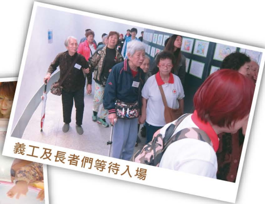
義工及長者們等待入場