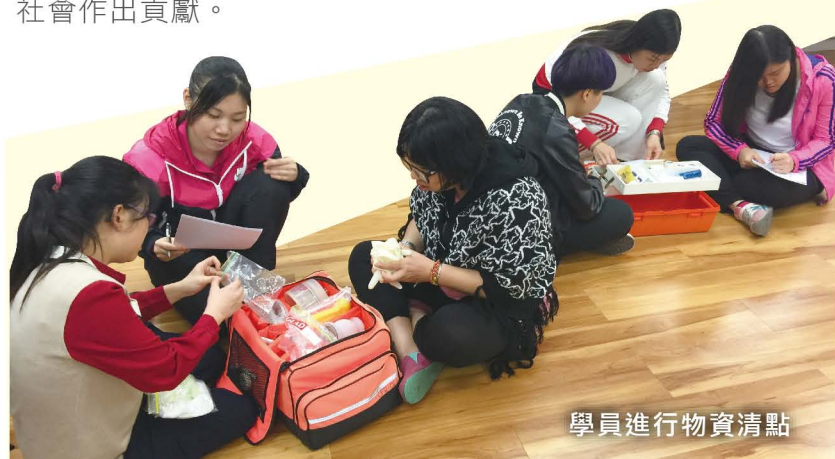
學員進行物資清點

我們期望新的計劃可以吸引更多有興趣先學習急救,然後加入義工行列的市民,同時亦希望藉此向大眾推廣紅十字精神,讓更多市民透過紅十字會一同為社會作出貢獻。