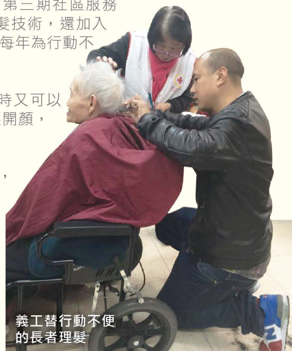
義工替行動不便的長者理髮

有受助的長者說道：「近年常感腳痛，活動能力已大不如前，行走得不遠，有義工上門幫忙剪髮，真的很方便！」更直言節省理髮費僅為其次，最重要是感受到義工的關懷。