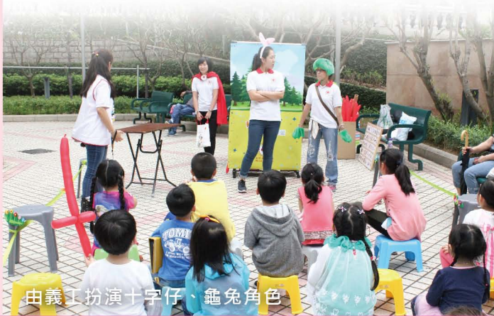
由義工扮演十字仔、龜兔角色

為了增加兒童對自然災害的認識，本會於4月9日及15日分別在華士古達嘉馬花園及黑沙環公園舉行「KID KID識災傳關愛」活動，希望從小培養兒童防災備災的意識。是次活動以4歲至9歲的小孩為主，透過街頭話劇表演及遊戲等形式，傳達自然災害的訊息並介紹求生包的作用，同時帶出紅十字運動精神，以及簡單處理傷口的方法。最後，主持人還教曉兒童求生包內6件物品的英文詞匯，既增加兒童們對英文單字的認識