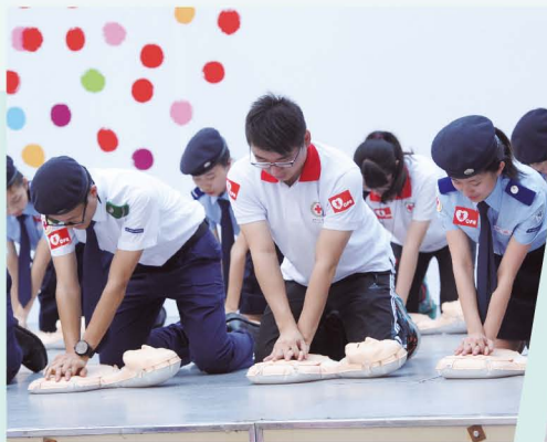
▲ 集體心肺復甦法演練