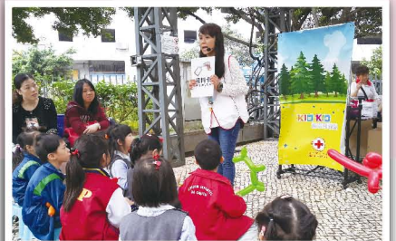
教授求生包內物品的英文生字及讀音