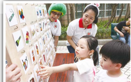
遊戲環節-找出求生包內的6件物品

就課題預備的求生包內放有手電筒、哨子、毛巾、瓶裝水、膠布及資料卡，而資料卡是用以寫上小孩的名字及家長的聯絡資料等，以便小孩走失後能聯絡上家長。