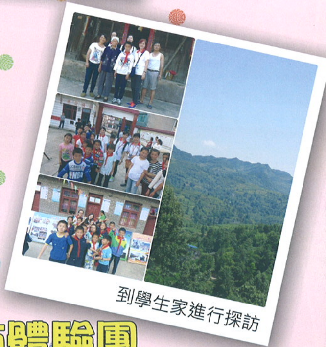
到學生家進行探訪

每年的暑假，澳門紅十字會都會組織本澳市民、學生、義工及青少年團團員到內地援建的博愛學校探訪交流。今年的目的地—貴州省銅仁市石阡縣永和村新濠博亞澳門紅十字博愛學校及舊校永和小學，活動目的是讓本澳居民認識澳門紅會的內地建校計劃，瞭解貧困地區的基礎教育狀況，考察紅會在內地的援建項目等。