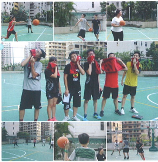
夏日狂歡-閃避球比賽