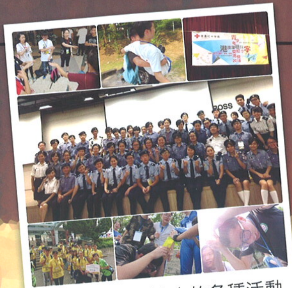
體驗交流中的各種活動