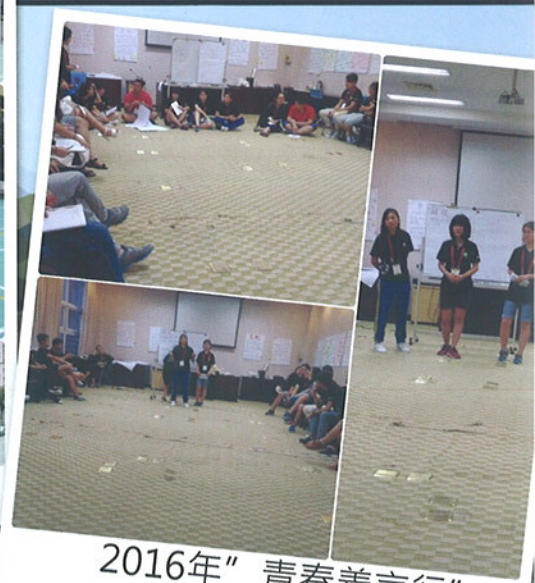
2016年“青春善言行” 青年同伴教育培訓班