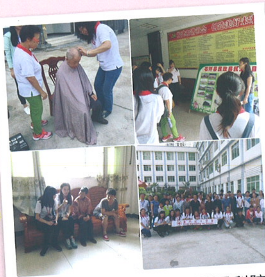
探訪石阡縣福利院