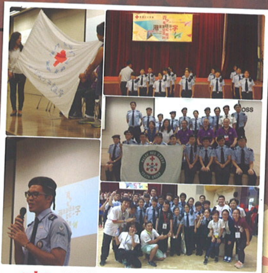
青少年 認識來自五地的好朋友