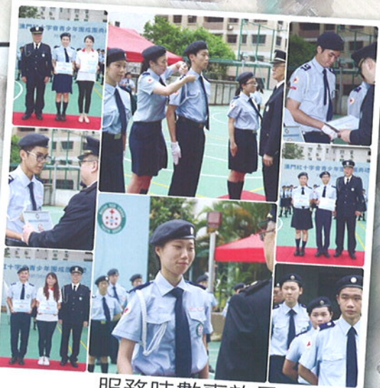
服務時數嘉許及 團隊領袖晉升