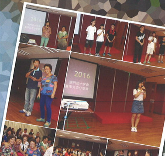
2016暑期交流活動分享會