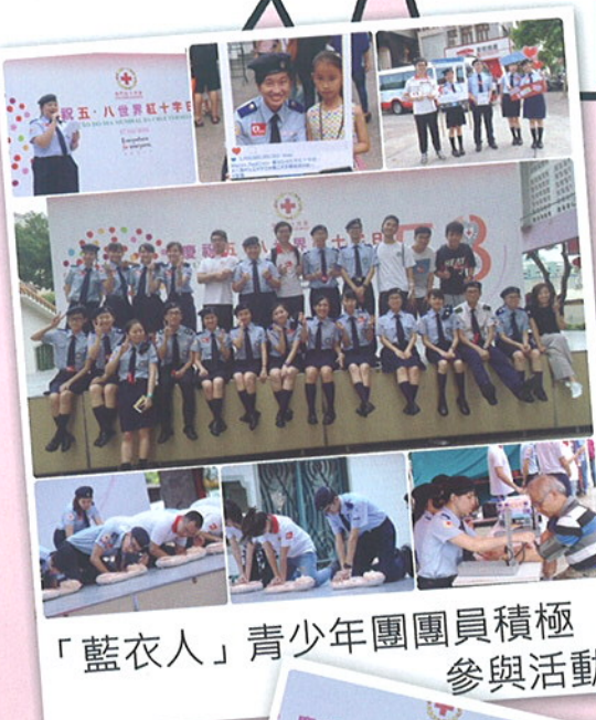
「藍衣人」青少年團團員積極參與活動