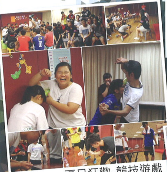
夏日狂歡-競技遊戲