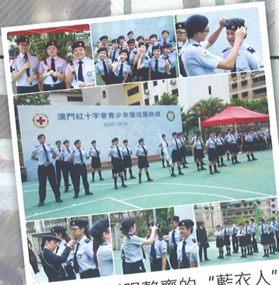
制服整齊的“藍衣人”