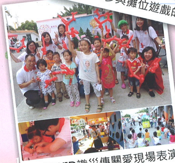
KIDKID識災傳關愛現場表演

為紀念這一重要日子，澳門紅十字會假氹仔花城公園舉行了紀念活動，內容包括急救短劇、CPR演練、攤位遊戲及識災備災短劇等，向本澳市民宣傳本會的各項工作，今年的活動還新增了“KIDKID識災傳關愛之識災短劇”及“圓咕碌劇場”，讓本澳的兒童及青少年有更多機會學習不同的事物。