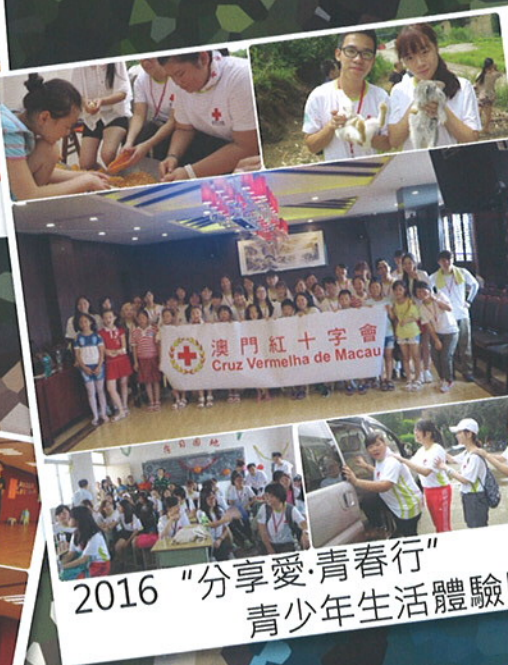
2016 “分享愛·青春行” 青少年生活體驗團