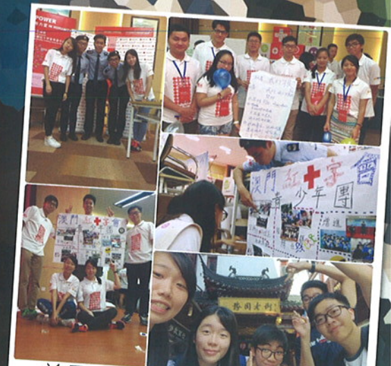
首屆全國紅十字青年峰會暨 2016年全國紅十字青年骨幹 訓練營