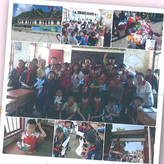
在學校與同學進行互動