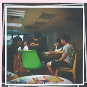
召集工作人員開會N次