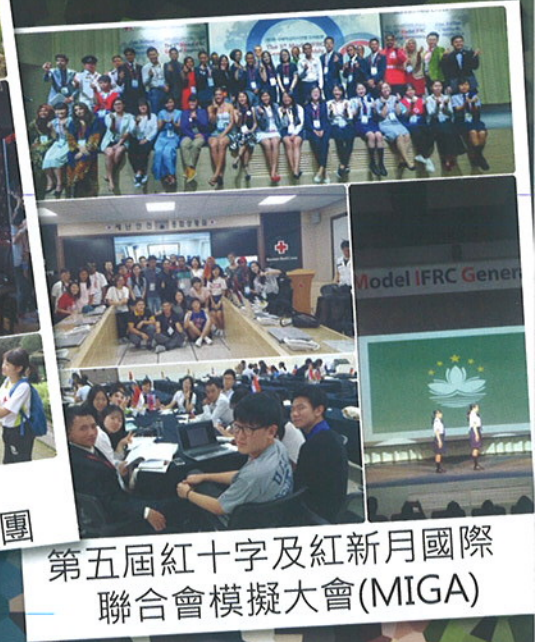
第五屆紅十字及紅新月國際 聯合會模擬大會(MIGA)