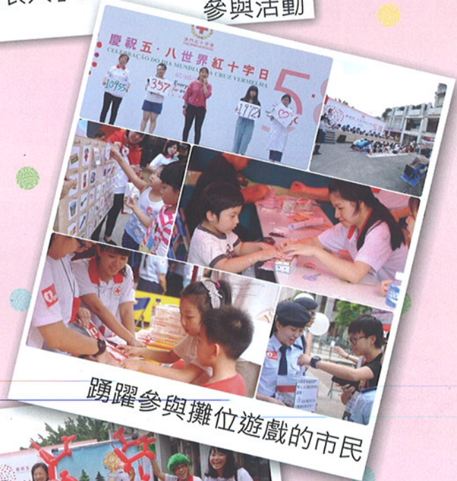
踴躍參與攤位遊戲的市民

“Everywhere for Everyone (處處為人人)”是今年世界紅十字日的主題，意思是貫徹國際紅十字與紅新月運動的宗旨，在世界各地不論國籍、膚色及種族等，努力防止及減輕人類疾苦。