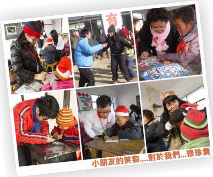
小朋友的笑容....對於我們...很珍貴