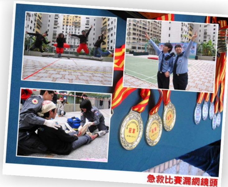
急救比賽漏網鏡頭

會是機技的當、隊須中隨成 本也好流日相洗團必從中力 是，最交當是清求，員賽努 賽戲的互賽也口講術隊比的 比頭學相比習傷到技，在日 救重所賽了練的，運練後平 急的踐競，前簡開者複，發 會中踐競，前簡開者複，發 字動實過，然賽從術傷反契， 十活們透當，現要紮作賽養應。 紅年員，。現要紮作賽養應。 每團會術表重包含在培機果。