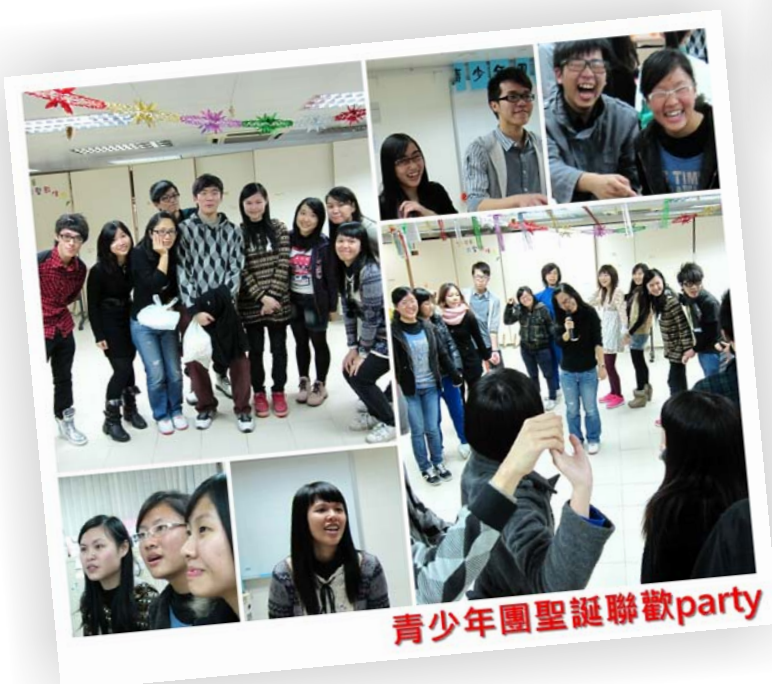
青少年團聖誕聯歡party

聖誕聯歡PARTY是新舊團員濟濟一堂互相認識的好機會，資深的團員當然不會錯過，看相片中團員們的笑臉，可想而知當晚的盛況了！