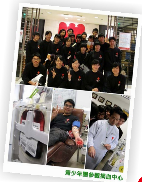
青少年團參觀捐血中心

又新一年了，回顧過去，展望未來，青少年團在過去一年，經歷了大大小小很多不同的活動，日子過去了365天，不知道有沒有伴隨著時間有所成長？過去了的冬季，團員經歷了紅十字會急救比賽，部份團員有機會到山西及黑龍江省進行義務教學交流，體會應該更多吧！就將這種種不同的經驗，好好沉澱，分享給將要加入我們的新成員。