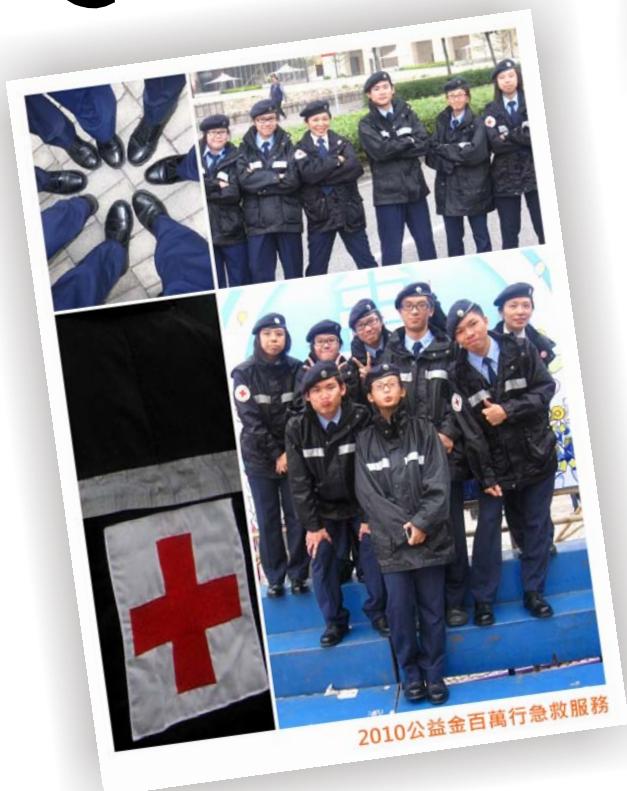
2010公益金百萬行急救服務

參與社區服務是青少年團實踐所學的最佳途徑，每次參與，都需要獻出愛心關懷，運用平時所學的關懷與溝通技巧、急救技術、量血壓技術等，當然，團員們都樂意參與，因為這是難能可貴的社會經驗。