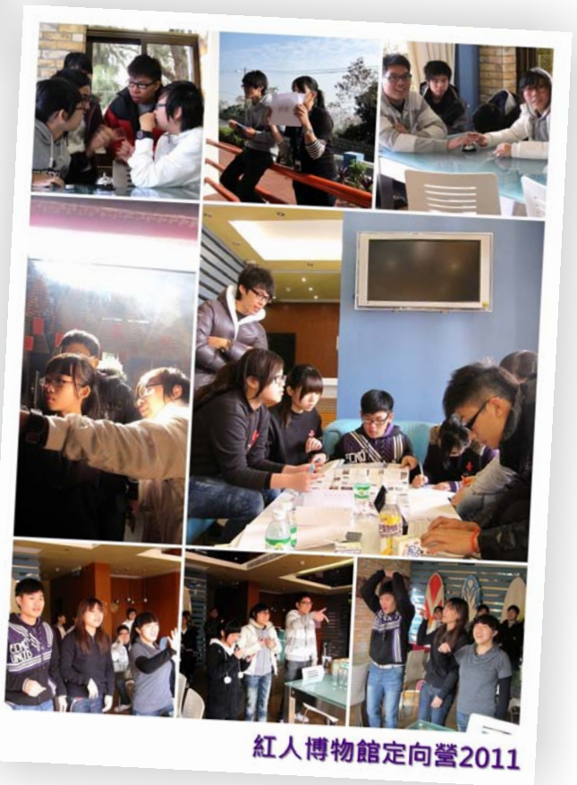
紅人博物館定向營2011

紅人博物館定向營2011是服務獎勵計劃的小組活動之一。今年的活動內容共分兩大部分，第一部分是紅十字運動知識作主題的問答比賽；另一部分是定向活動，以競賽方式走訪了澳門的世遺景點，透過觀察發掘澳門世遺有趣的部分。