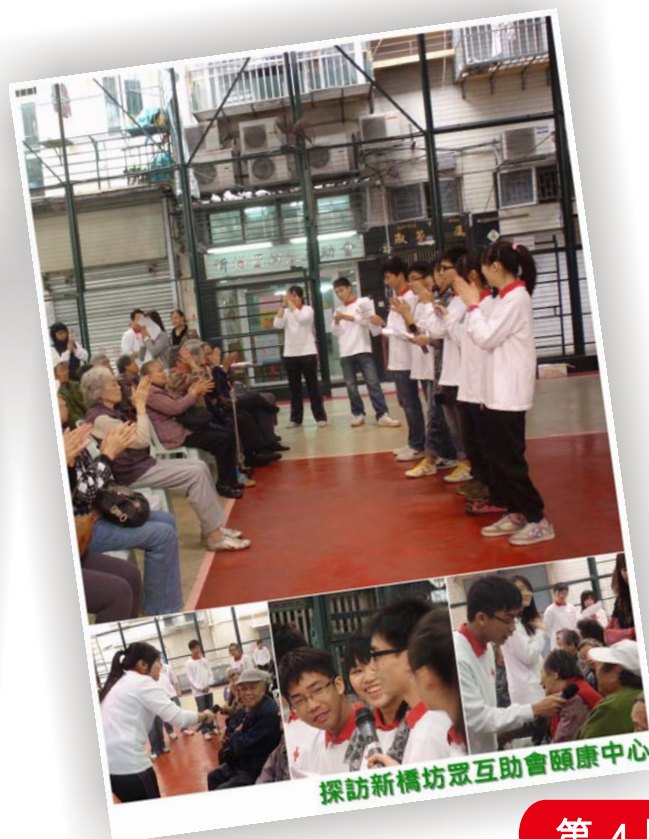
探訪新橋坊眾互助會頤康中心