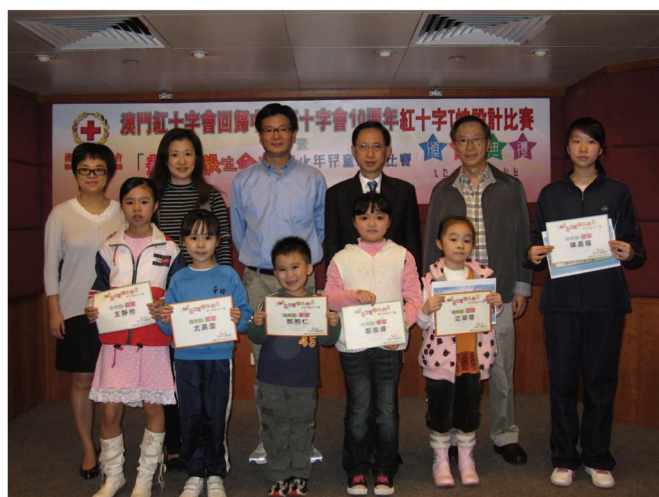
2009畫出堅毅生命力頒獎典禮

倘若觸電者未脫離電源，切忌直接或用金屬制品接觸患者，否則會因金屬的導電性造成更多人觸電。