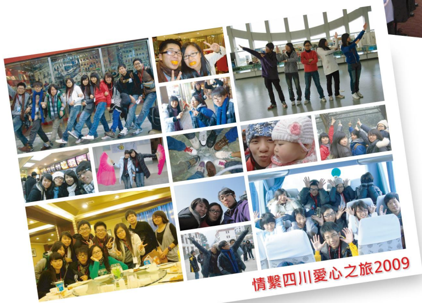
情繫四川愛心之旅2009