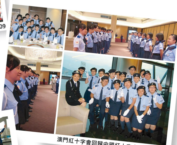
澳門紅十字會回歸中國紅十字會10週年酒會

參與本會加入中國紅十字會十週年紀念的酒會，作為“紅會人”的一份子，是無上的光榮。